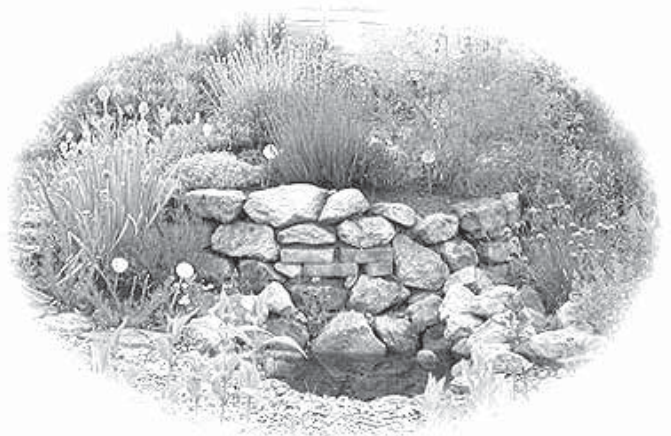
Kräuterspirale im 'Heilenden Garten' (Schaugarten der Kräuterei im Gartenkulturzentrum 'Park der Gärten' in Rostrup/Bad Zwischenahn)

Alle erwähnten Pflanzen gibt es in der Kräuterei.